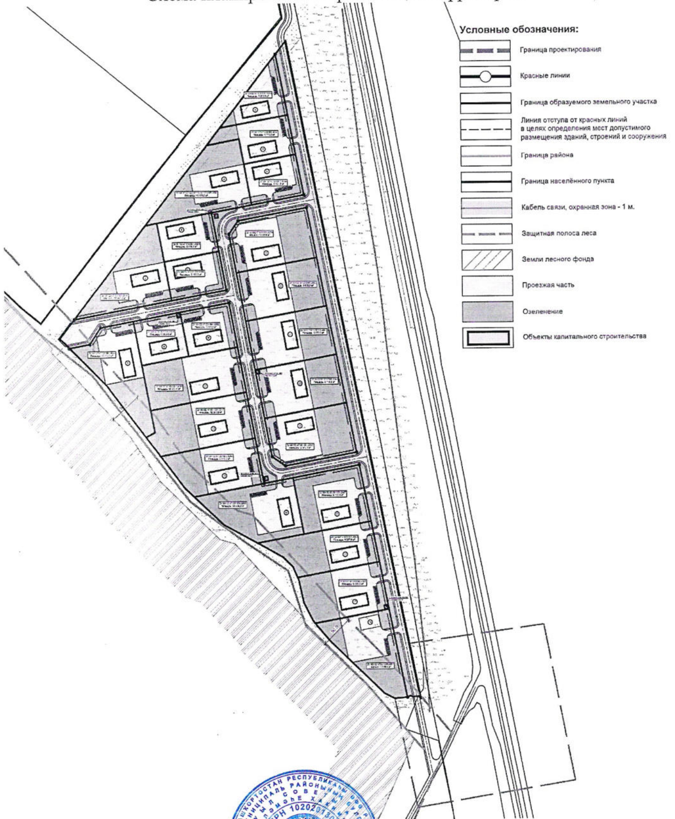
Схема планировочной организации территории.

Глава сельского поселения Булгаковский сельсовет МР Уфимский район РБ