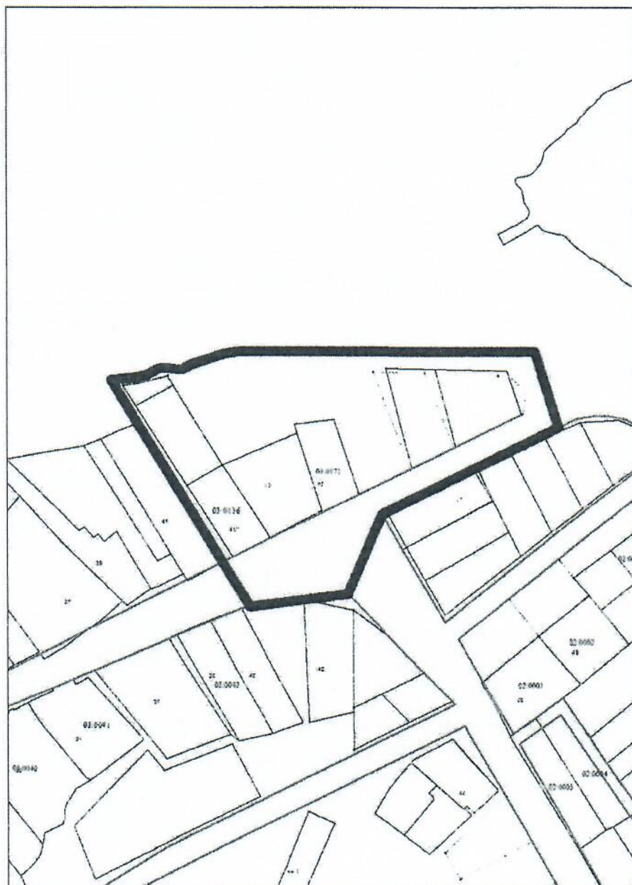
СХЕМА РАЗМЕЩЕНИЯ ОБЪЕКТА